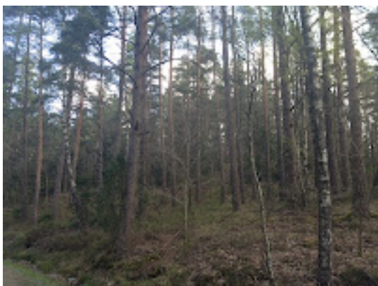
Kontinuitetsskog ungefär enligt Lübeckmodellen. Får växa vidare till en ännu ståligare olikåldrad tallpelarsal, samtidigt som yngre ek, björk och tall får växa till sig.