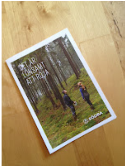
Det är lönsamt för Södra och Södras entreprenörer att skicka ut röjningsreklam så de kan gallra massaved enklare framöver. Underlag av björkparkett.

Alla åtgärder, utom initiala skogsbruksplaner, blir i Lübeckmodellen lönsamma för skogsägaren. Dessutom lämpar sig metoden utmärkt för den självverksamme, då man i så fall kan välja att göra mindre omfattande gallringar av utvalda träd. Och det behövs ingen förbannad röjsåg.