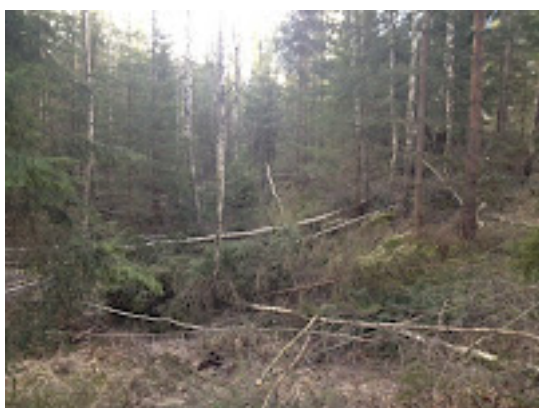
Röjd skog. Jag ser i avdelningen kostnader för ca 5000:- kronor och prima ved till 2-3 villors årsbehov av värme (via ved eller fjärrvärme) som nu får ruttna bort i skogen

"Modernt" svenskt skövelbruk av skogen är slutavverkning(aka kalhygge)-plantering(1)-röjning(2)-förröjning(3)-förstagallring(4)-förröjning(5)-gallring(6)-förröjning(7)-slutavverkning(8).